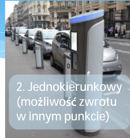
2. Jednokierunkowy (możliwość zwrotu w innym punkcie)