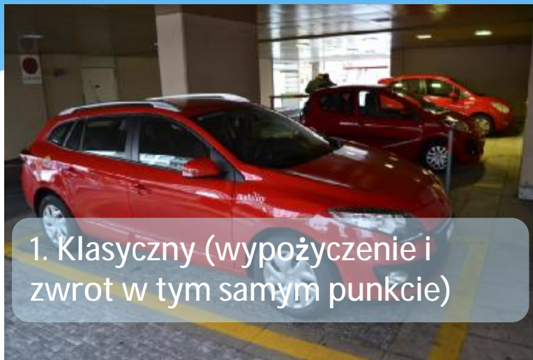
1. Klasyczny (wypożyczenie i zwrot w tym samym punkcie)