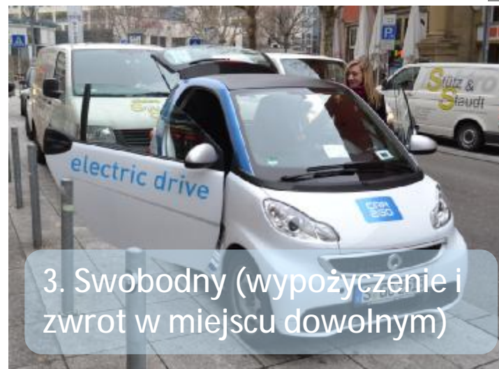
3. Swobodny (wypożyczenie i zwrot w miejscu dowolnym)